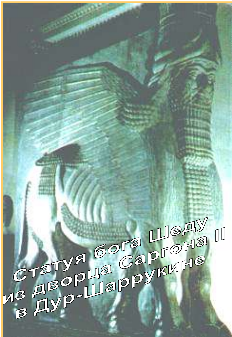
Статуя бога Шеду из дворца Саргона II в Дур-Шаррукине