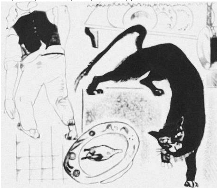
«А Васька слушает да ест» (Крилов)

Як ви зрозуміли зміст прислів'їв, наведених у п.2 «Стыдно говорить, но грех утаить», «Он и Бога не боится, и людей не стыдится», «Ни стыда, ни совести».